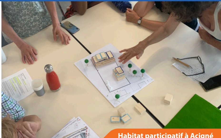
Habitat participatif à Acigné

Le groupe «Vivre en habitat Participatif à Acigné» est motivé par :