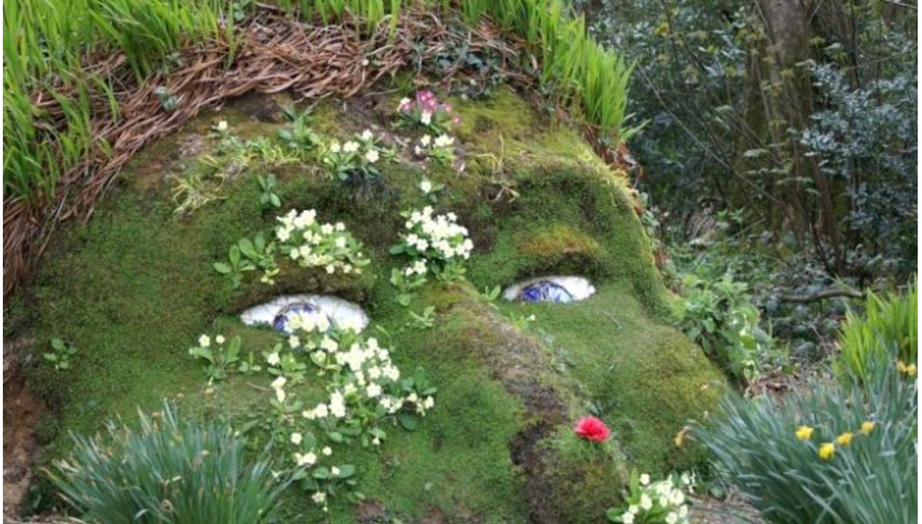
Jade MASSA pour l'Oasis de la Cambrousse.